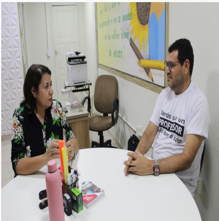
Reunião com o Secretário Municipal de Educação