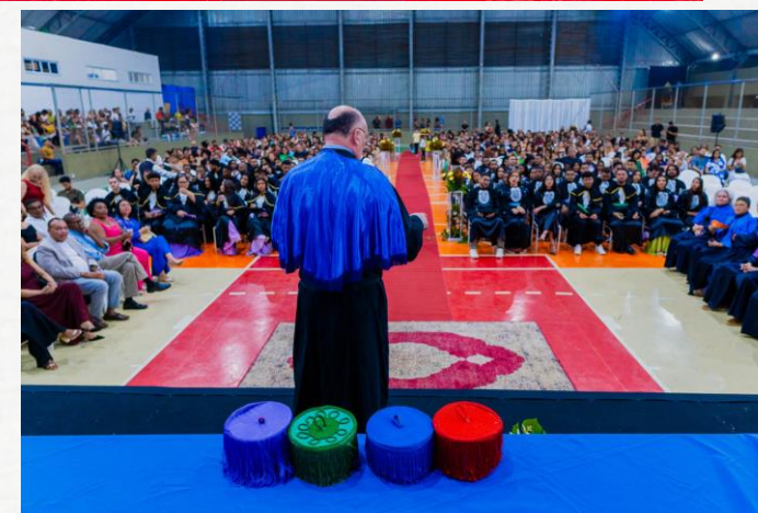
Colação de Grau