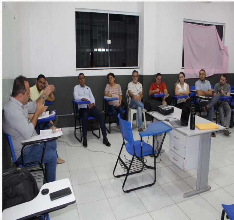
Reunião com Preceptores do Internato