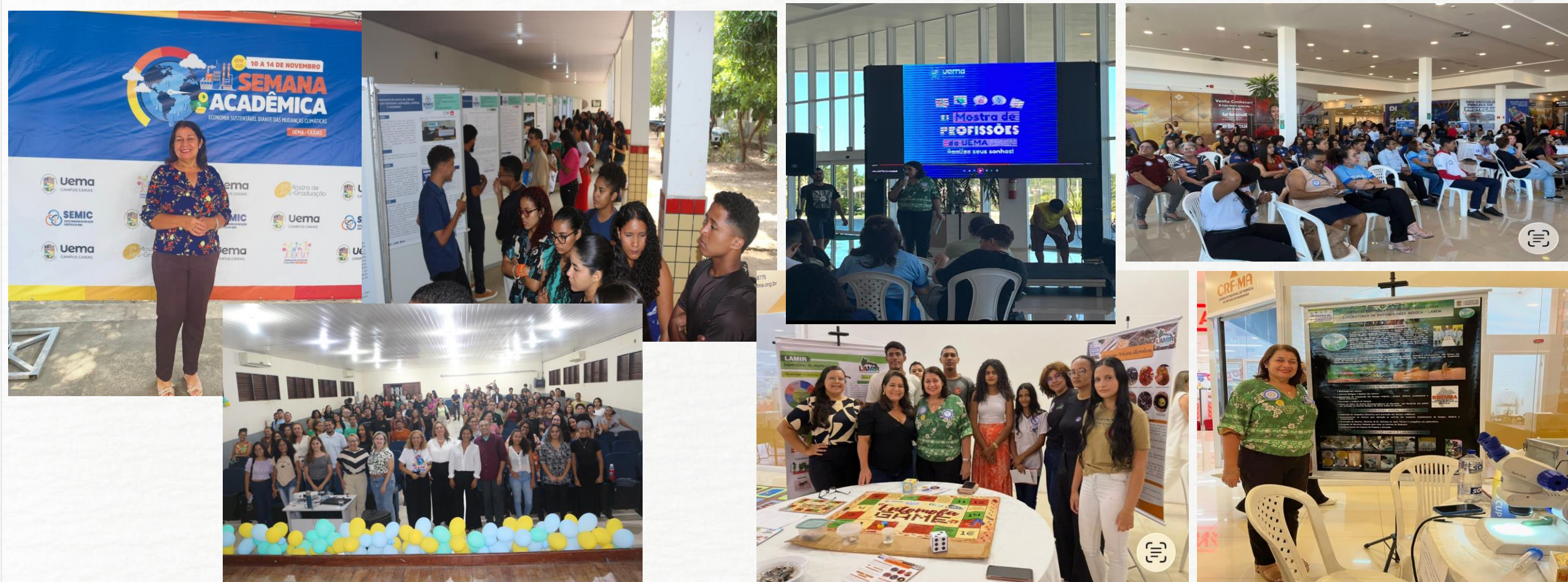
Semana Acadêmica, Campus Caxias foi uma Regional – 10 a 15 de novembro 2025