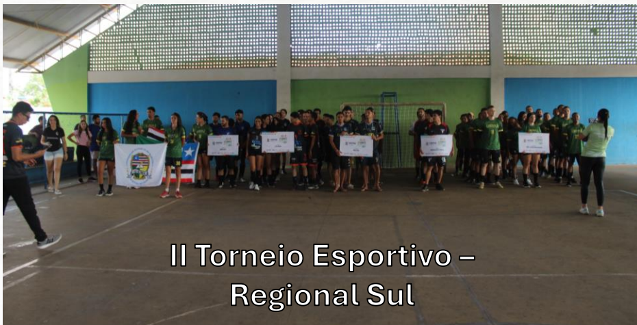
II Torneio Esportivo – Regional Sul