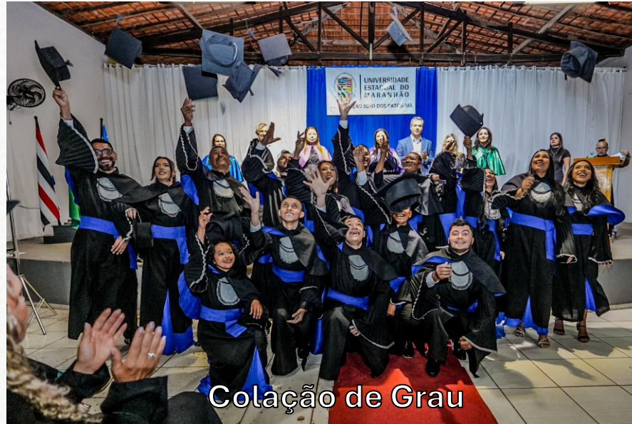
Colação de Grau