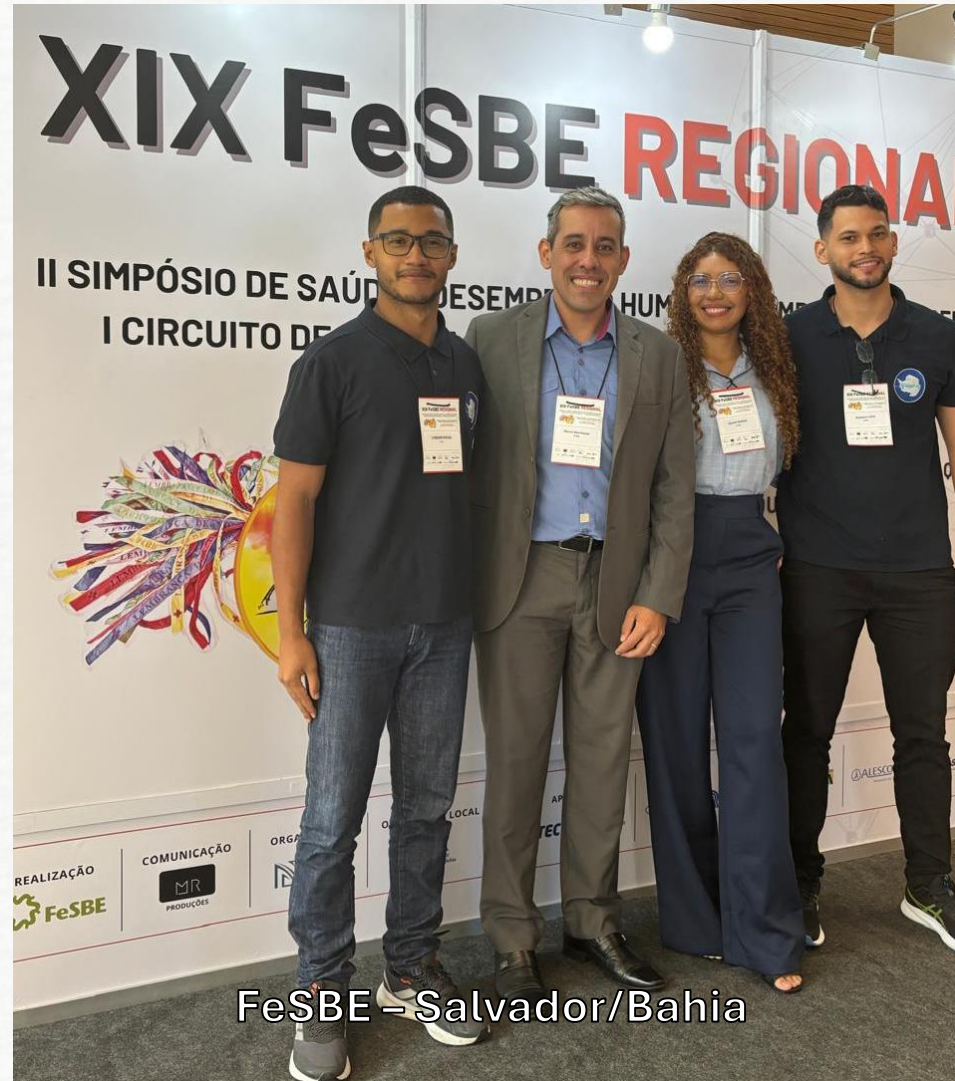
FeSBE – Salvador/Bahia