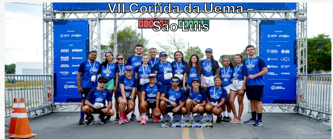
VII Corrida da Uema – São Luis