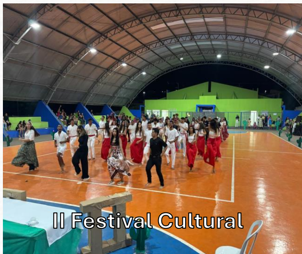
II Festival Cultural