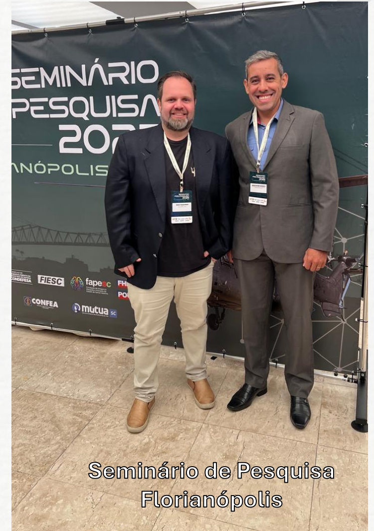
Seminário de Pesquisa Florianópolis