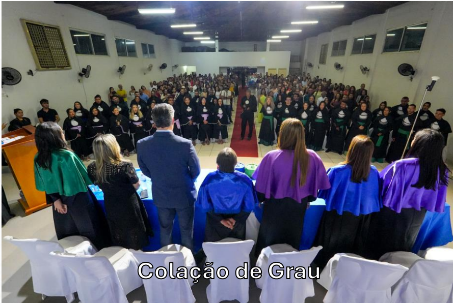
Colação de Grau