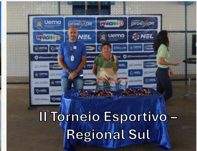
II Torneio Esportivo – Regional Sul