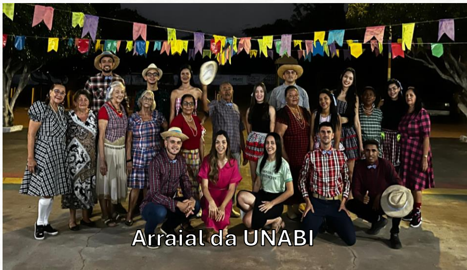
Arraial da UNABI