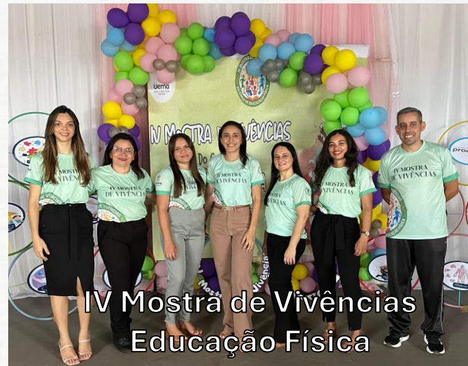
IV Mostra de Vivências Educação Física