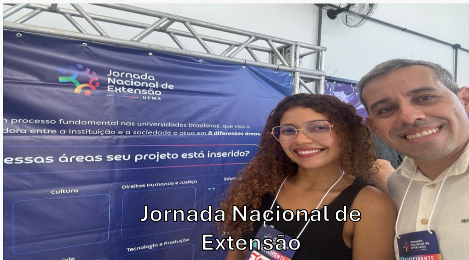
Jornada Nacional de Extensão