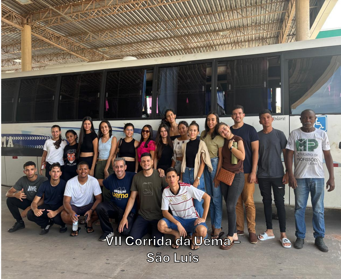
VII Corrida da Uema – São Luis