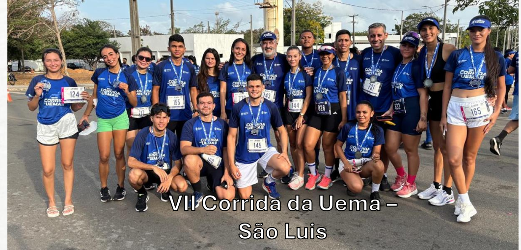
VII Corrida da Uema – São Luis