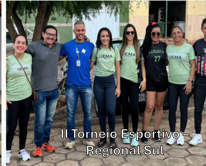
II Torneio Esportivo – Regional Sul