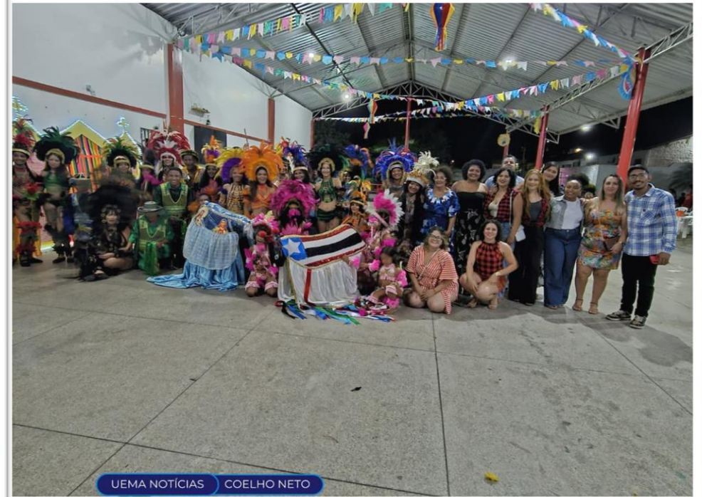
Arrial da UEMA