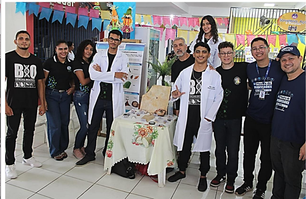
Feira das Profissões