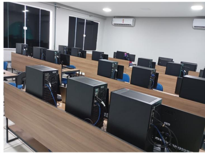
Laboratório de Informática