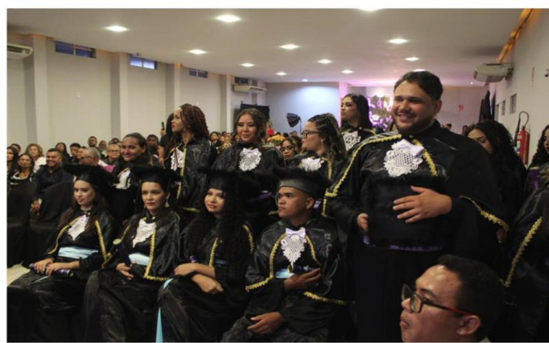
Colação de grau