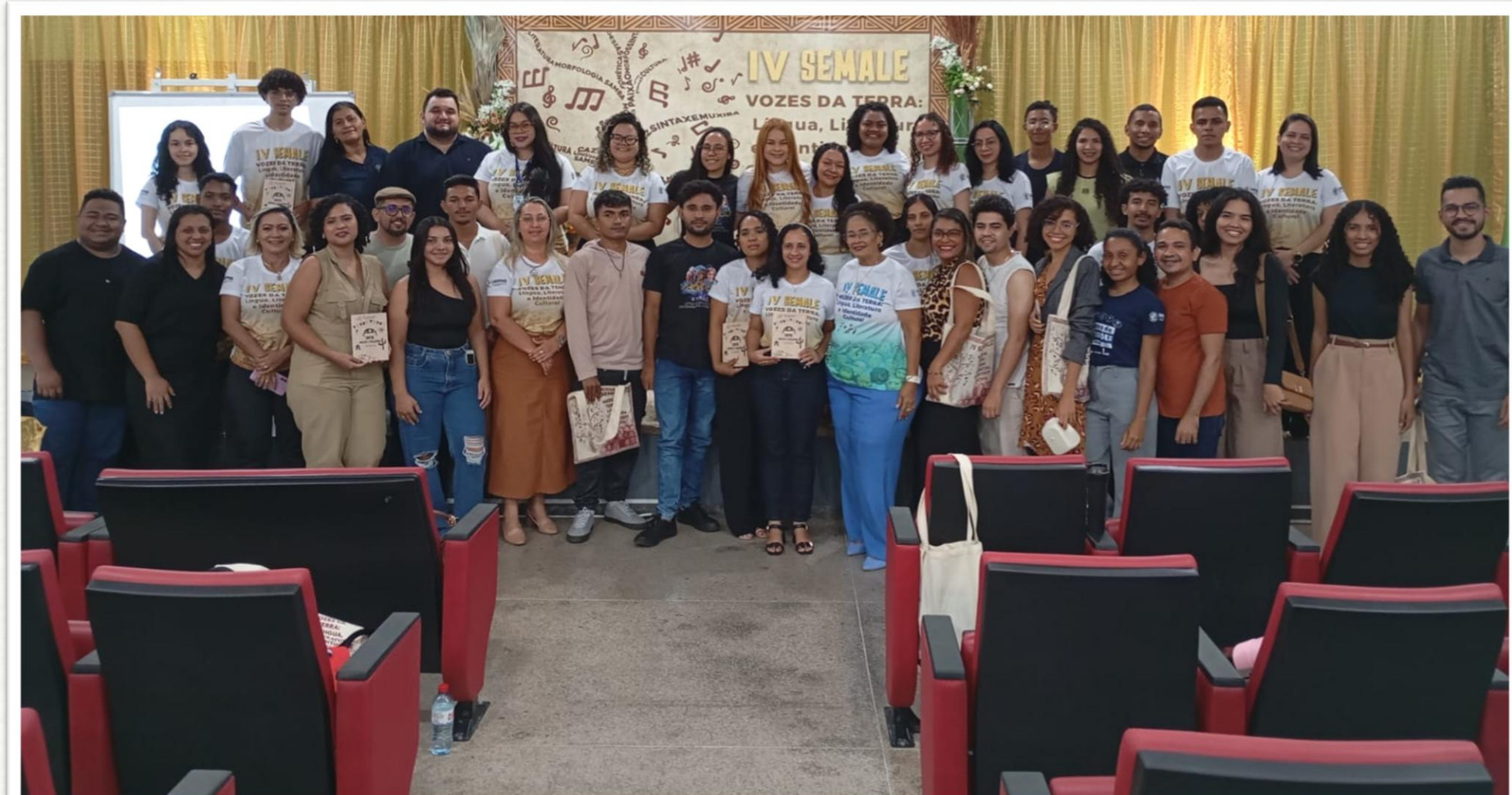
SEMANA DE LETRAS