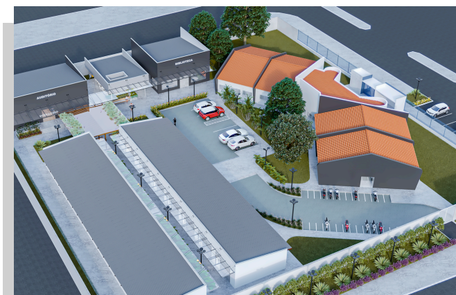
Imagem: Projeto de Ampliação do Campus