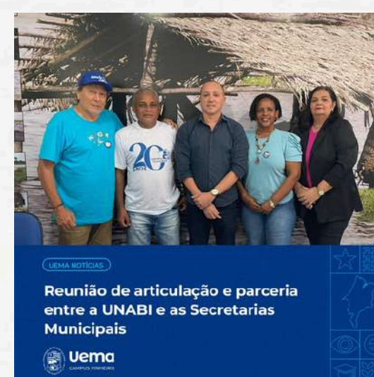
UEMA NOTÍCIAS Reunião de articulação e parceria entre a UNABI e as Secretarias Municipais Uema