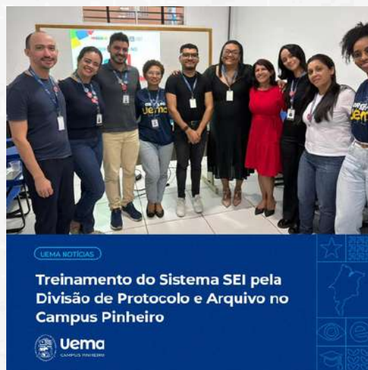
UEMA NOTÍCIAS Treinamento do Sistema SEI pela Divisão de Protocolo e Arquivo no Campus Pinheiro Uema