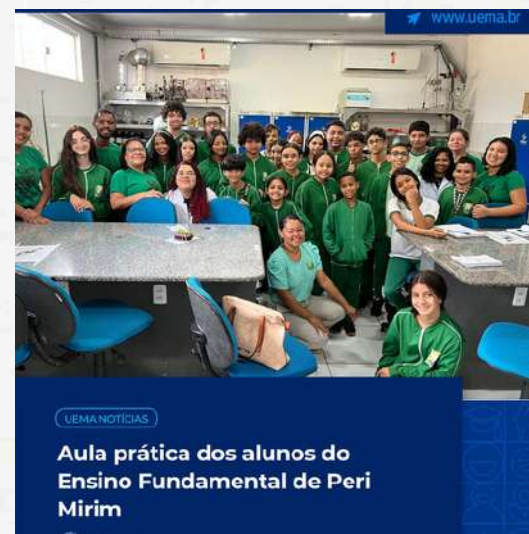
UEMA NOTÍCIAS Aula prática dos alunos do Ensino Fundamental de Peri Mirim Uema