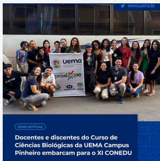
UEMA NOTÍCIAS Docentes e discentes do Curso de Ciências Biológicas da UEMA Campus Pinheiro embarcam para o XI CONEDU Uema