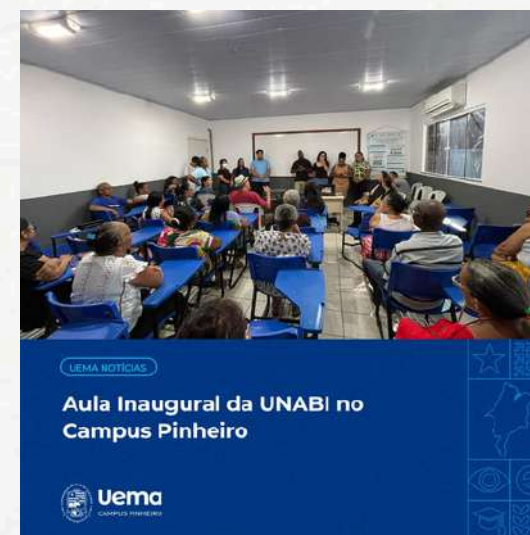
UEMA NOTÍCIAS Aula Inaugural da UNABI no Campus Pinheiro Uema