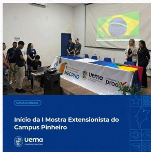
UEMA NOTÍCIAS Início da I Mostra Extensionista do Campus Pinheiro Uema