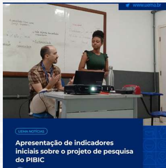
UEMA NOTÍCIAS Apresentação de indicadores iniciais sobre o projeto de pesquisa do PIBIC Uema