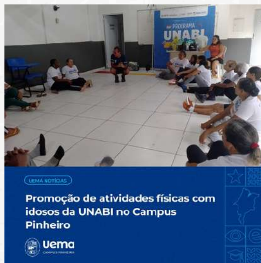
UEMA NOTÍCIAS Promoção de atividades físicas com idosos da UNABI no Campus Pinheiro Uema