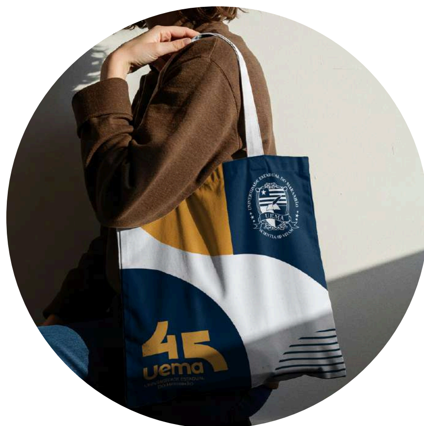
Materiais promocionais (canetas, bottons, ecobags etc)