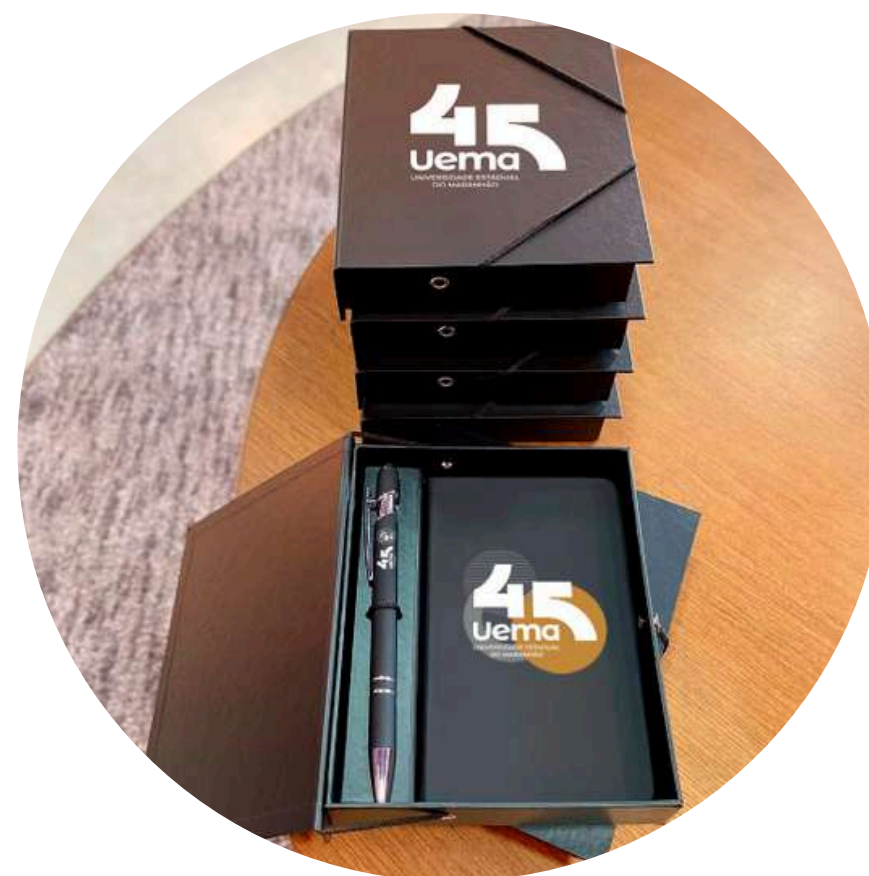
Caixa com caneta e caderno (Modelo já utilizado pela Uema, atualizado para os 45 anos)