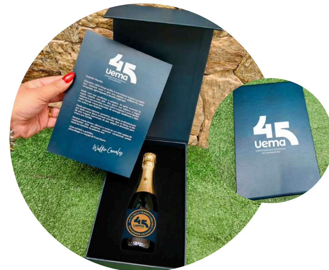
Caixa com espumante personalizado (Para presentear figuras ilustres)