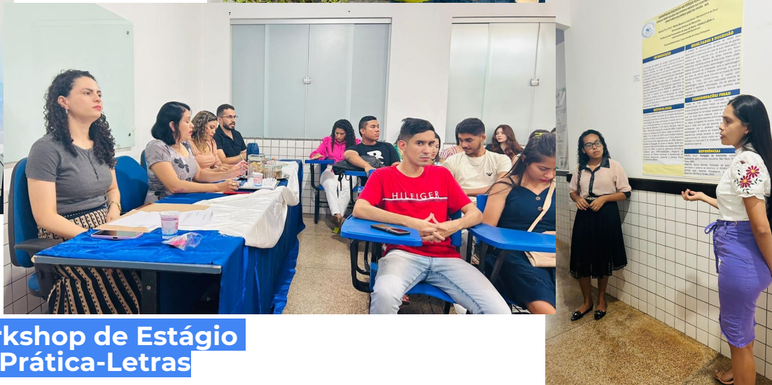
I Workshop de Estágio e Prática-Letras