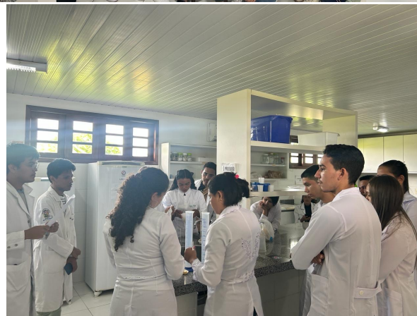
Aula de campo na Uema Campus Paulo VI-C.Biológicas