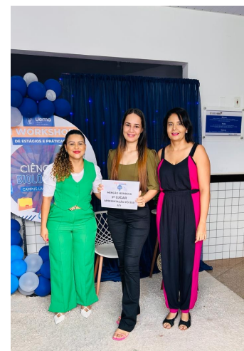
Workshop de Práticas e Estágio-C.Biológicas