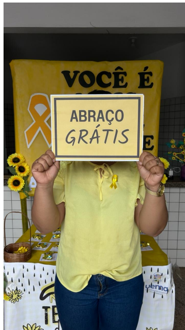
Ações Setembro Amarelo