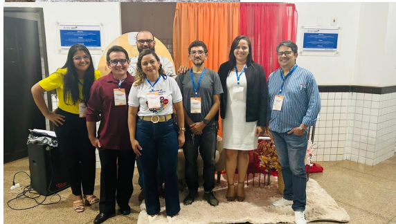
I Fórum de Ensino, Pesquisa e Extensão-Novembro