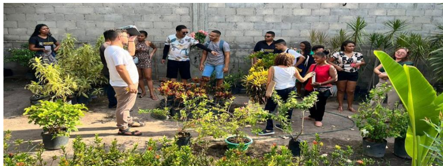
Imagem 3. Visita técnica ao Aconchego das Plantas na disciplina de Paisagismo no curso Design de Interiores - PROFITEC.