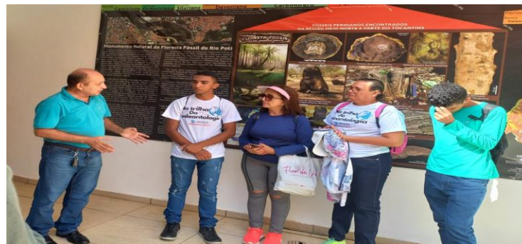
Imagem 2. Visita técnica da turma de Geografia (UEMANet) ao Museu da UFPI-PI.