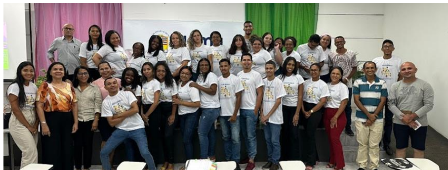
Imagem 1. Turmas do Programa Ensinar durante o Seminário de Prática Curricular.