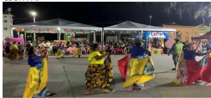
Imagem 4. Participação da UNABI no arraial Campus Codó, com apresentação do Carimbó e outras danças típicas.