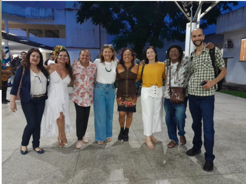
CARNAVAL DA UEMA