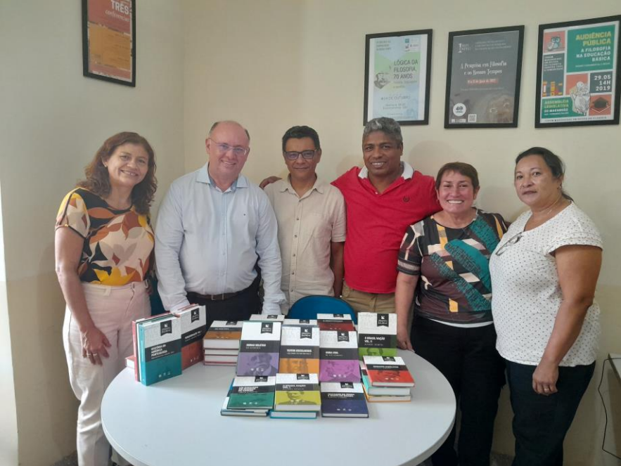
REUNIÃO VICE-REITORIA E DEFIL