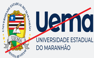
EXEMPLO DE DISTORÇÃO

Quando aplicada em qualquer formato ou extensão (pdf, bmp e outros) não deverão acontecer distorções provocadas pelas ferramentas de ampliação ou redução de imagens desse tipo. Assim como não deverão ser usados recursos de aplicações de sombras ou quaisquer outros efeitos visuais que modifiquem o padrão original da marca.