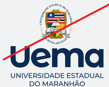
EXEMPLO DE ALTERAÇÃO NA ESCALA ENTRE OS ELEMENTOS