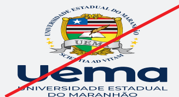
EXEMPLO DE DISTORÇÃO