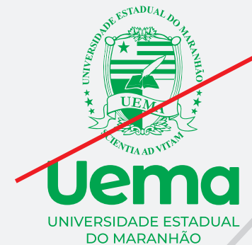
EXEMPLO DE ALTERAÇÃO DE COR