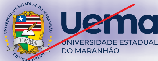
EXEMPLO DE SOMBREAMENTO